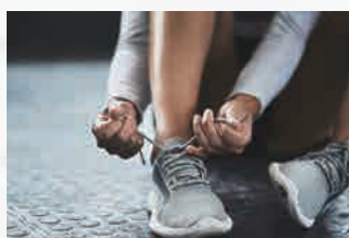
運動靴・スパイク