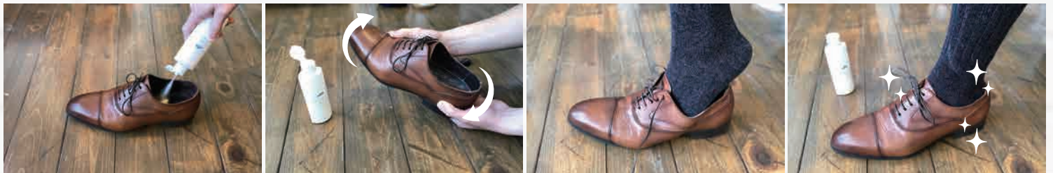
①パウダーを振りかける

※パウダーが付着し靴の中や靴下などが白くなる場合があります ※素材や散布量によっては残り具合が異なります