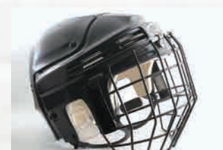
ヘルメット・プロテクター

※革靴など色付きの物にご使用の場合は、パウダー（白い粉）が革靴の表面などに付着すると目立つ場合がありますのでご注意ください。