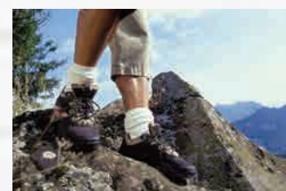
トレッキングシューズ