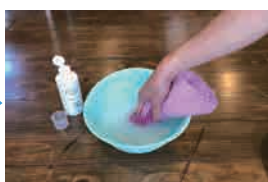
①ニオイクリーンを適量の水で薄めタオルに染み込ませる