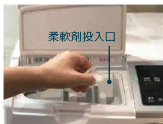
柔軟剤の臭いを抑えたい方に 柔軟剤 + ニオイクリーン