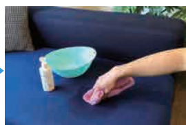
②臭いの気になる場所を叩き拭きする