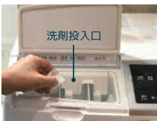
汗や生乾き等の臭いを取りたい方に 洗剤 + ニオイクリーン