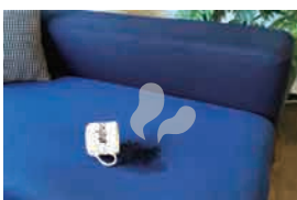
飲み物やペットのおしっこなど、こぼした臭いが気になる場合にもリセットを！