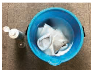
強力な臭いを取りたい方に つけ置き洗い + ニオイクリーン